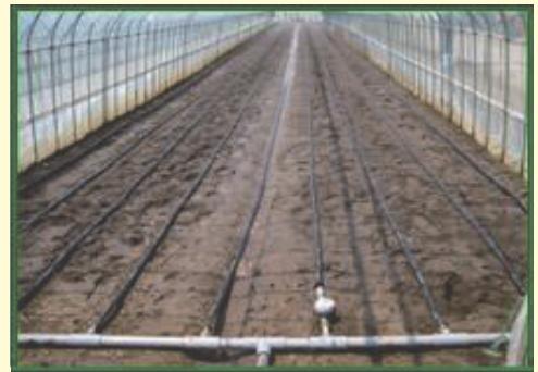
散水チューブによる処理