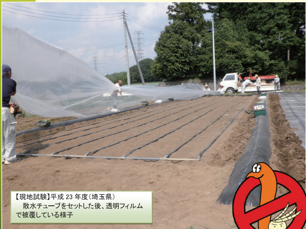
【現地試験】平成 23 年度(埼玉県) 散水チューブをセットした後、透明フィルム で被覆している様子