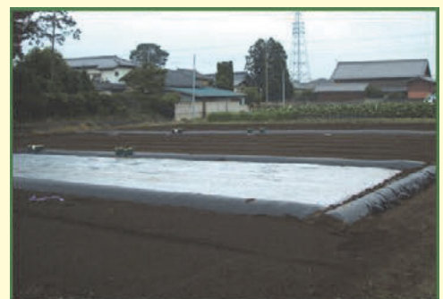
うね立て&マルチによる土手